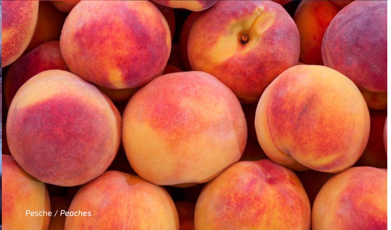
Pesche / Peaches