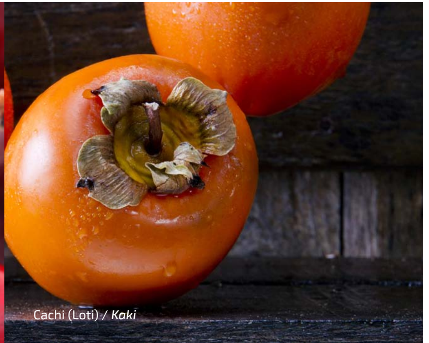
Cachi (Loti) / Kaki