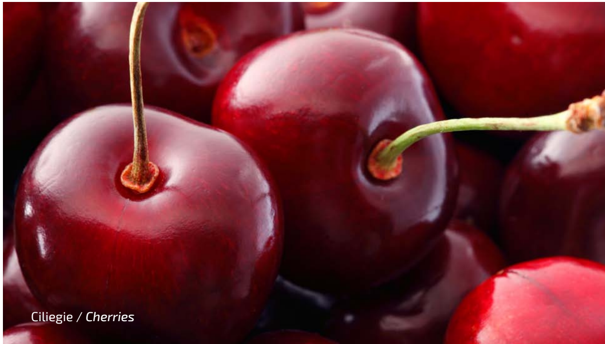
Ciliegie / Cherries