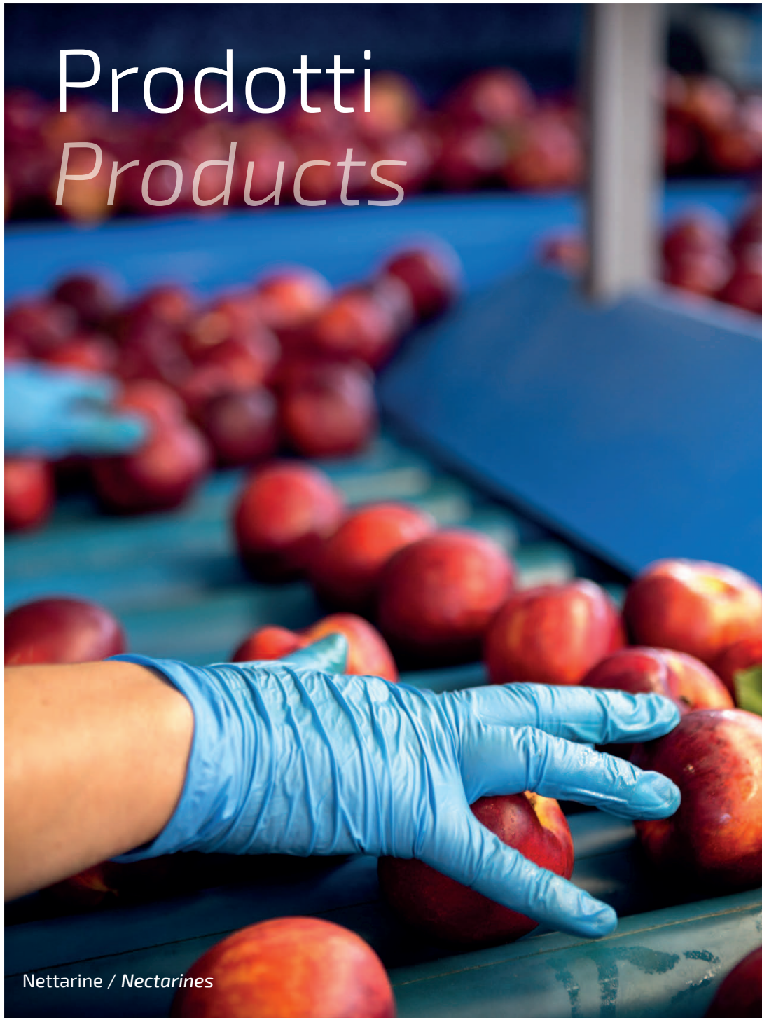
Nettarine / Nectarines