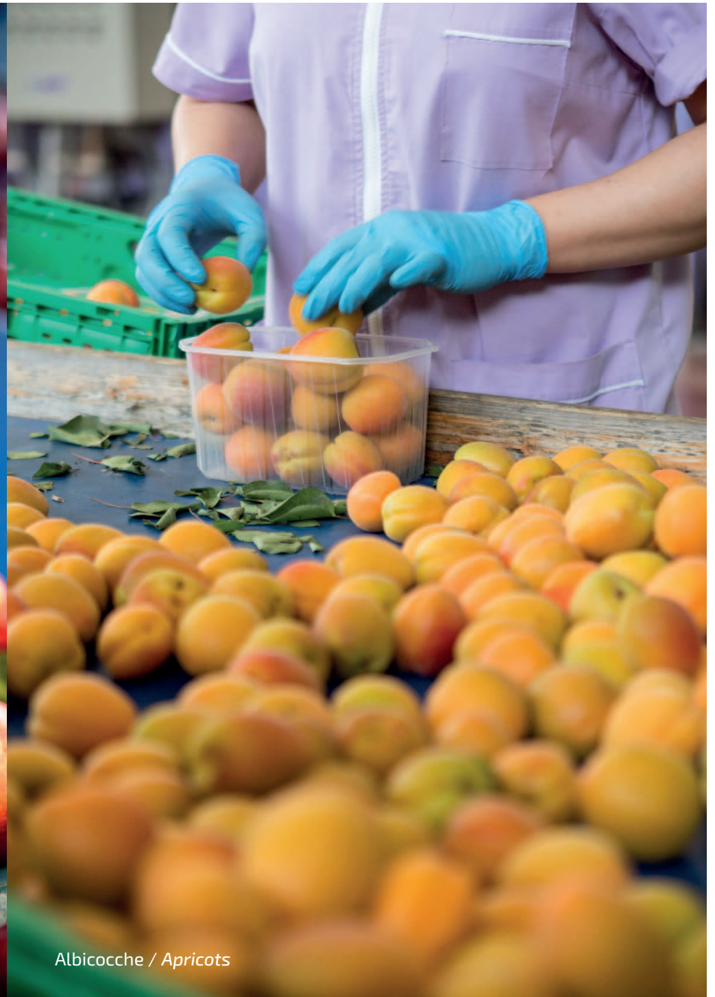
Albicocche / Apricots