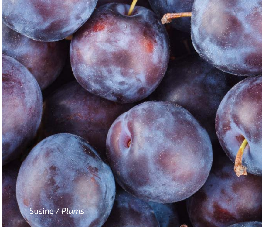
Susine / Plums